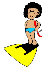
Nuoto Pinnato Tarvisium ASD - Treviso

Il Presidente della Società, con l'iscrizione alla manifestazione, dichiara sotto la propria responsabilità che tutti gli atleti, giudici, tecnici e dirigenti tesserati con la propria Società partecipano alle attività sportive ed alla manifestazione organizzata in forma spontanea e senza alcun vincolo e obbligo di partecipazione in quanto organizzata in forma dilettantistica e di svago, dichiarando altresì, che tutti i tesserati si impegnano a non chiedere il risarcimento dei danni al comitato Organizzatore per infortuni non rimborsati dalla Società di assicurazione. Dichiara inoltre, in base al consenso scritto validamente prestato da parte dei propri Soci, ai sensi dell'art. 13 della legge n. 196/2003, di autorizzare il Comitato Organizzatore ad utilizzare e gestire, per i suoi fini istituzionali e per gli scopi che riterrà più opportuni nell'ambito della propria attività, nominativi, foto, video ed immagini ottenute durante lo svolgimento delle manifestazioni, sempre nel rispetto dell'immagine e dell'interesse dei partecipanti, escludendo qualsiasi forma di cessione a terzi o di distribuzione o di commercializzazione delle immagini.